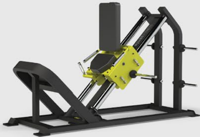
ARTICULADO AGACHAMENTO Hack AT 1029