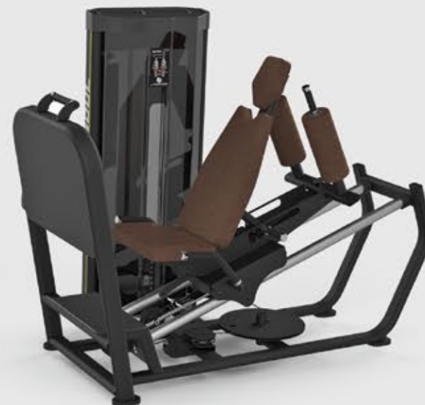
LEG PRESS BANCO REGULÁVEL SL 1024