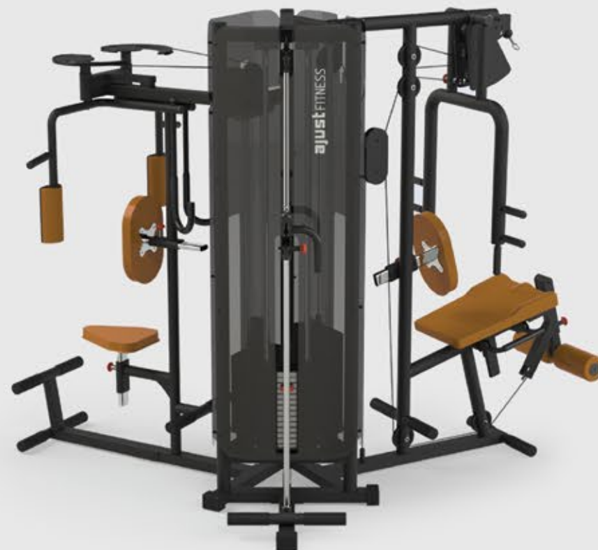
ESTAÇÃO MULTIFUNCIONAL COM CARENAGEM ES 1003 PLUS

• Além de garantir um visual mais atraente, a carenagem proporciona muito mais segurança durante a operação