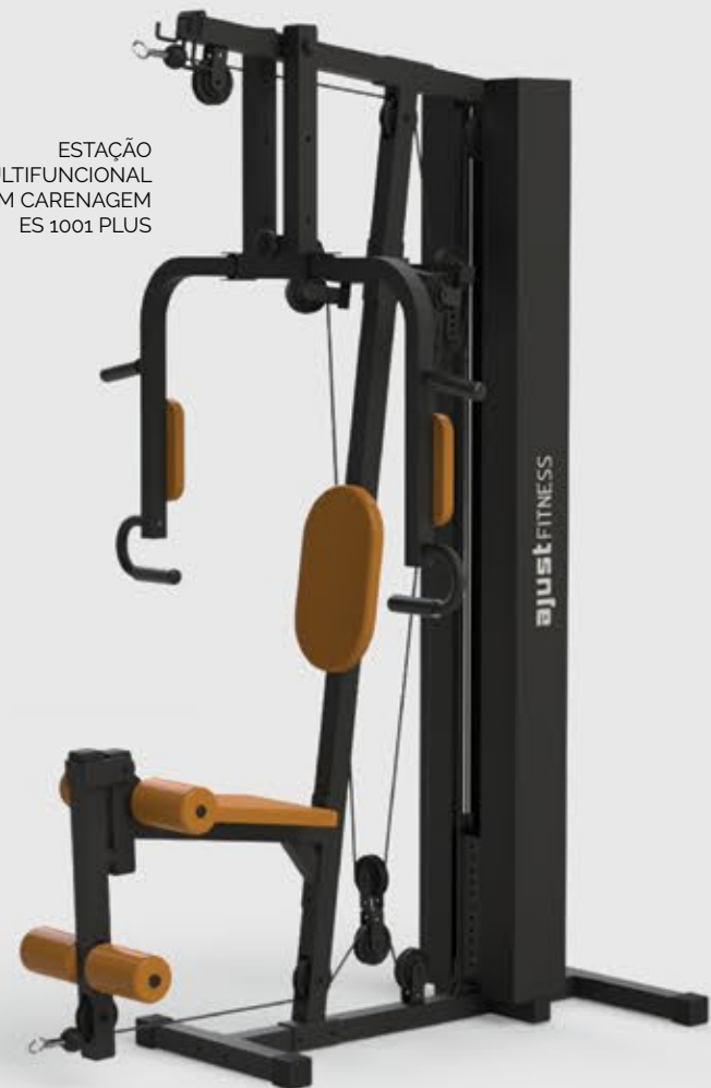
ESTAÇÃO MULTIFUNCIONAL COM CARENAGEM ES 1001 PLUS

• Grande variedade de treinos em um só equipamento