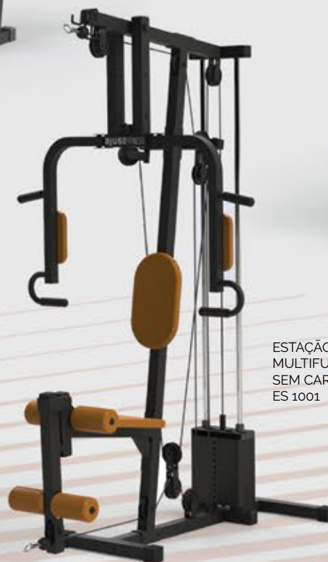
ESTAÇÃO MULTIFUNCIONAL SEM CARENAGEM ES 1001