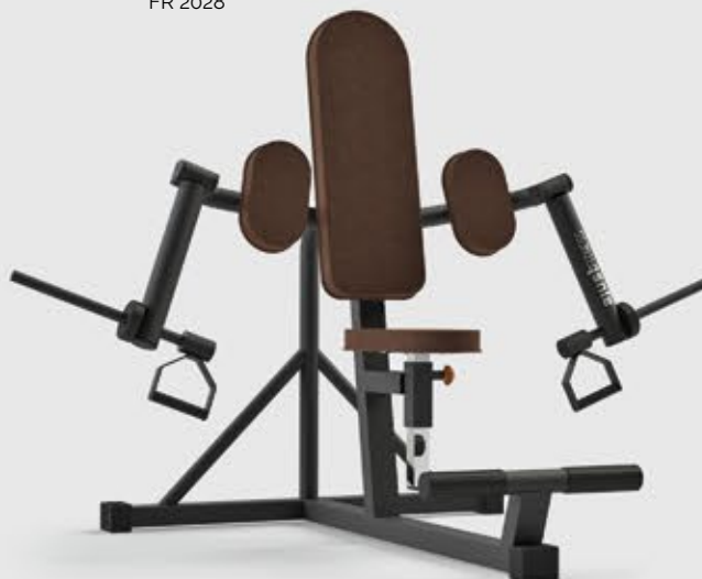
BÍCEPS ARTICULADO FR 2028