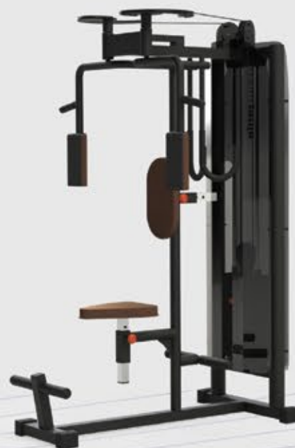
VOADOR PEITORAL/DORSAL FR3 2024 PLUS

Alto padrão de acabamento com detalhes em aço Inox