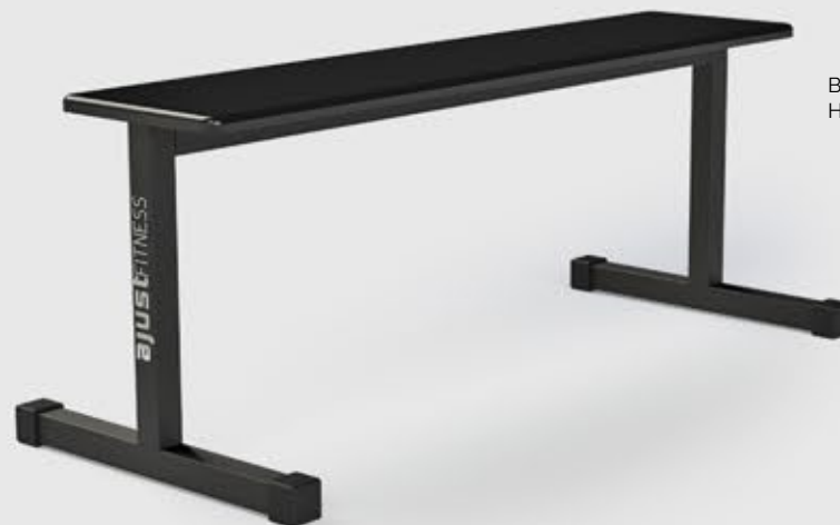
BANCO RETO HM 2043

• Mais estabilidade e eficiência na execução dos exercícios