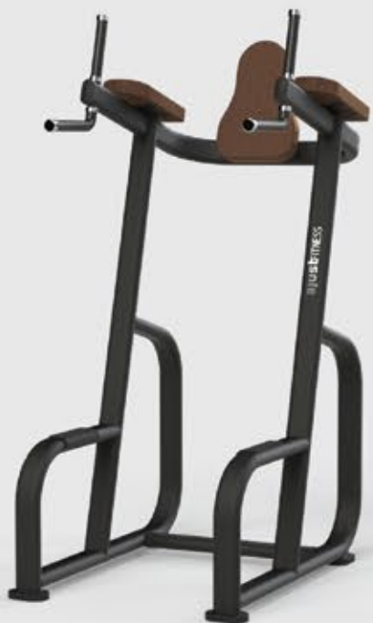
PARALELA ABDOMINAL SL 2044