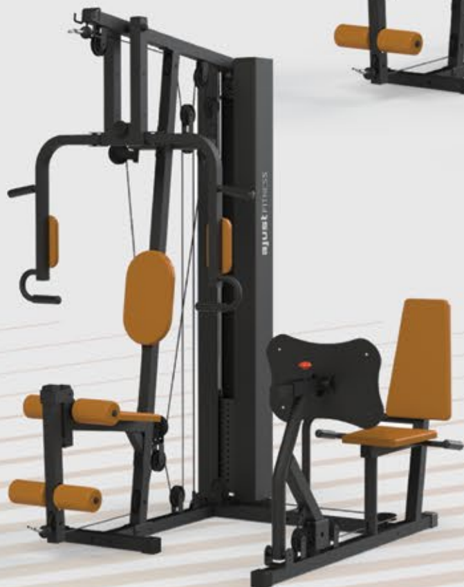
ESTAÇÃO MULTIFUNCIONAL COM LEG PRESS E CARENAGEM ES 1002 PLUS