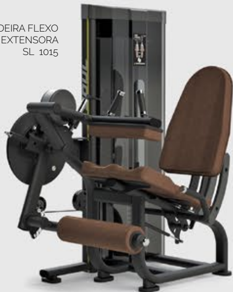
CADEIRA FLEXO EXTENSORA SL 1015