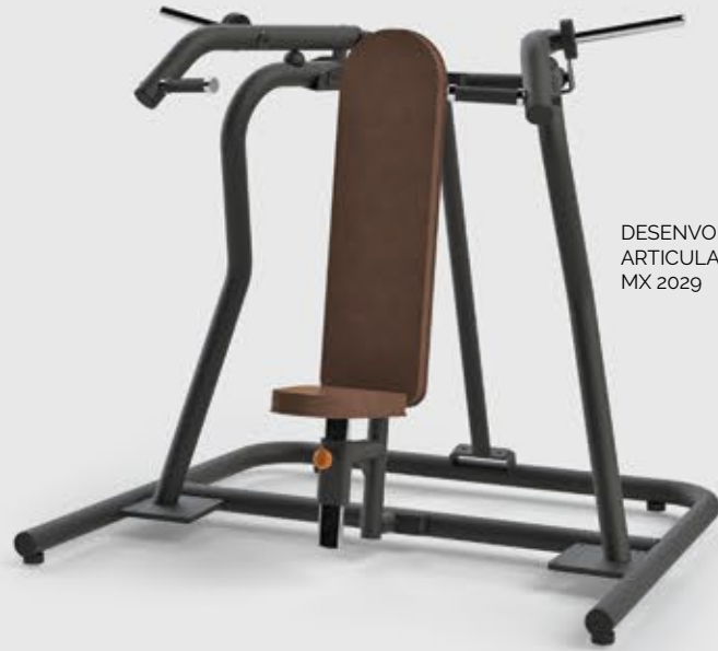
DESENVOLVIMENTO ARTICULADO MX 2029