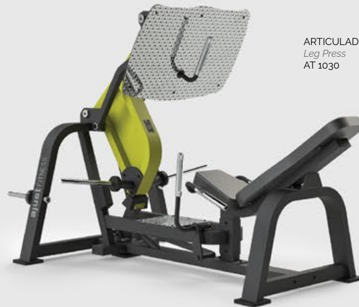
ARTICULADO Leg Press AT 1030