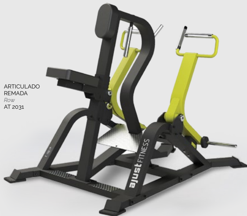
ARTICULADO REMADA Row AT 2031