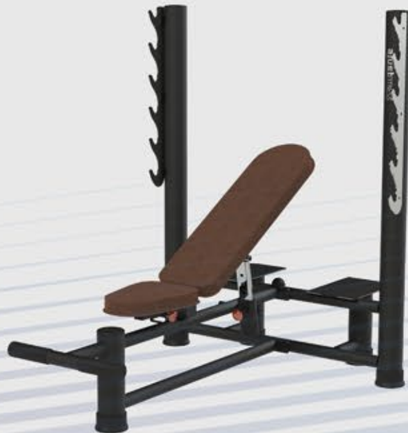
BANCO DE SUPINO REGULÁVEL RETO/INCLINADO MX 2050

Acesse todos os produtos da Linha Maximus pelo QR Code