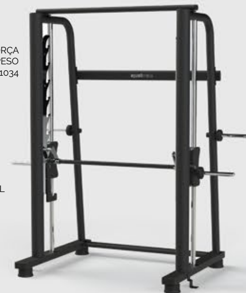
MULTIFORÇA SEM CONTRAPESO MX 1034