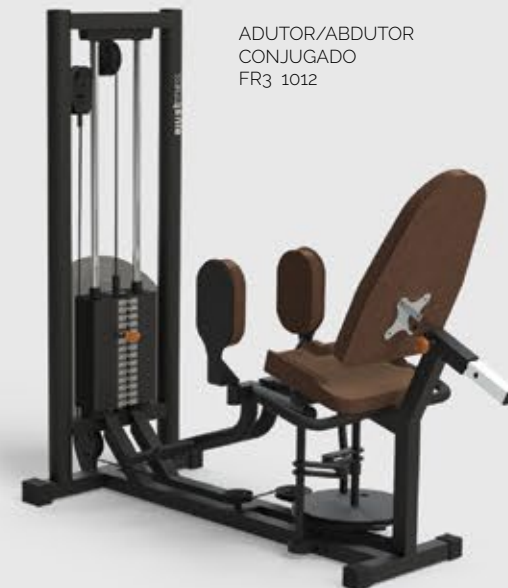
ADUTOR/ABDUTOR CONJUGADO FR3 1012

Todos os equipamentos da Linha FR3 podem ser produzidos com carenagem total (Plus) ou baixa. Veja a diferença nos equipamentos acima.