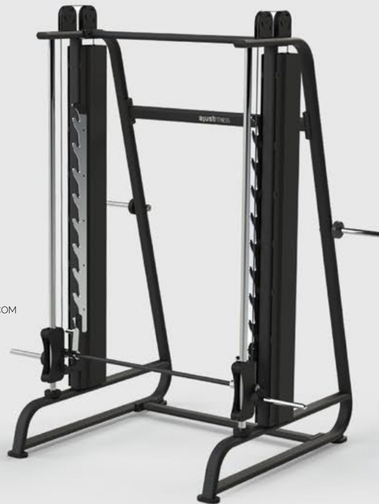
MULTI FORÇA COM CONTRAPESO SL 1033