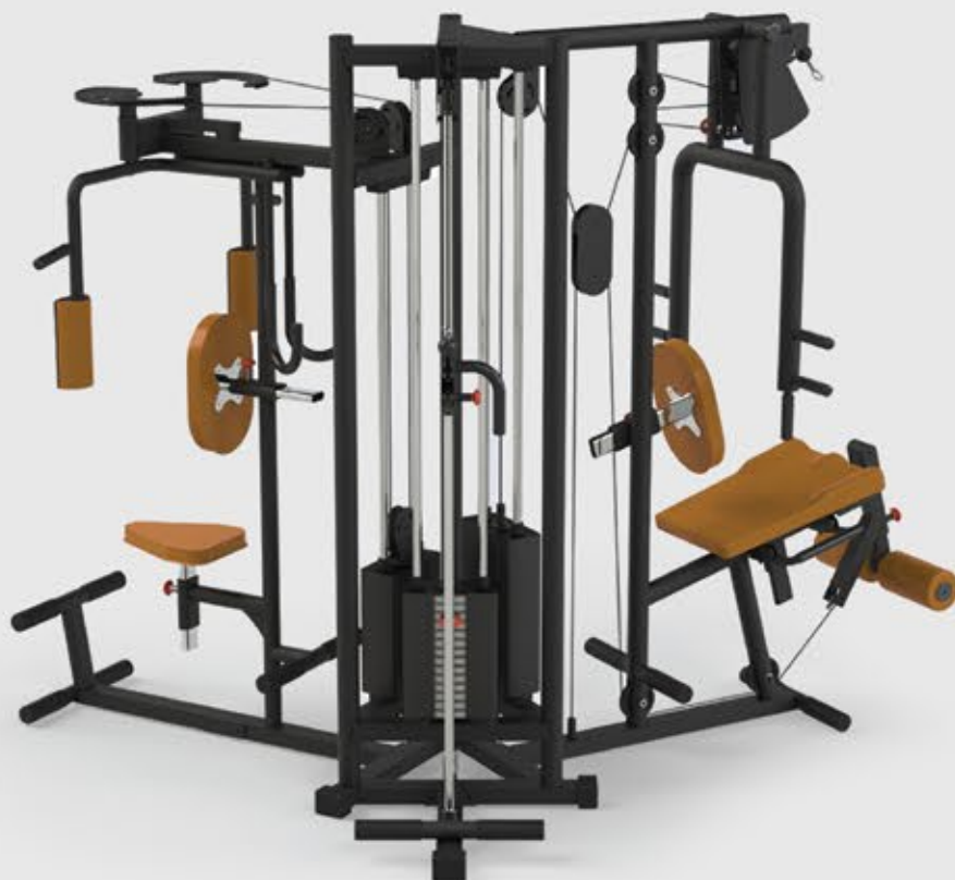
ESTAÇÃO MULTIFUNCIONAL SEM CARENAGEM ES 1003

3 USUÁRIOS SIMULTÂNEOS COM 3 TORRES DE PESO