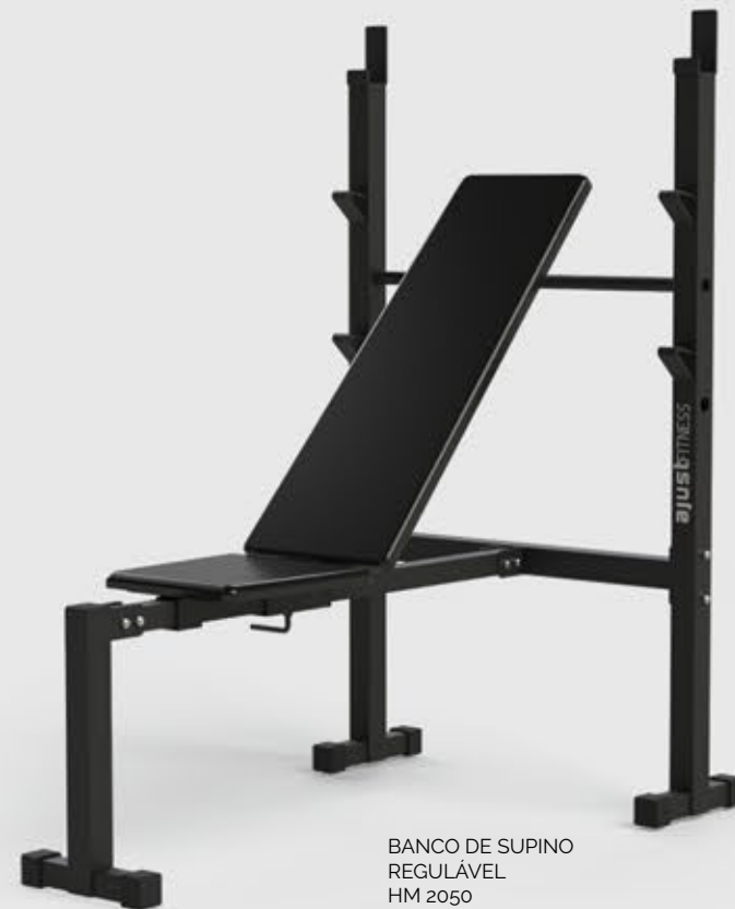
BANCO DE SUPINO REGULÁVEL HM 2050

• Múltiplos treinos em um só equipamento