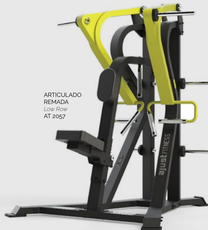
ARTICULADO REMADA Low Row AT 2057