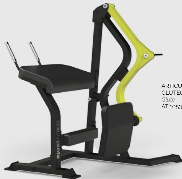
ARTICULADO GLÚTEO Glute AT 1053