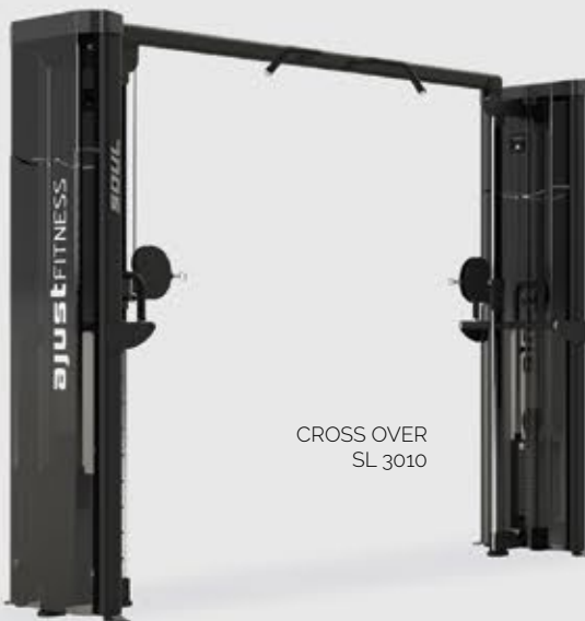
CROSS OVER SL 3010