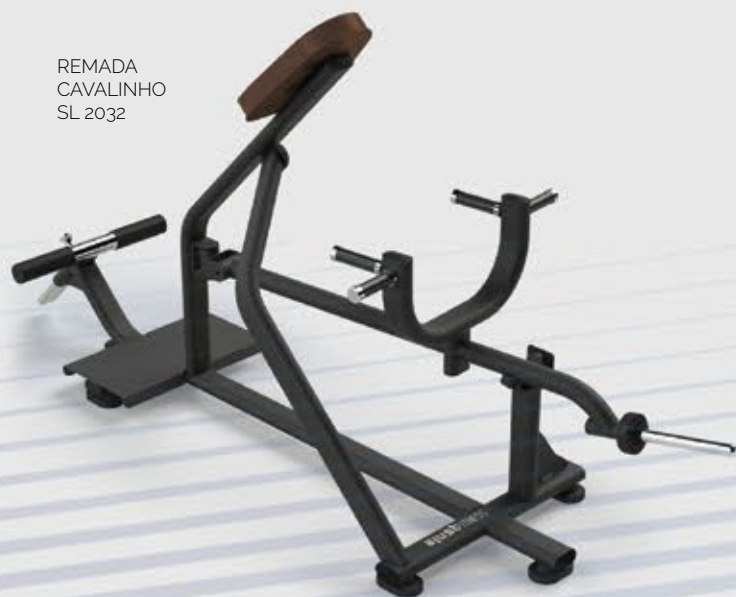
REMADA CAVALINHO SL 2032