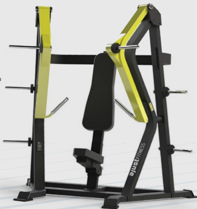
ARTICULADO SUPINO DECLINADO Declined bench press AT 2025