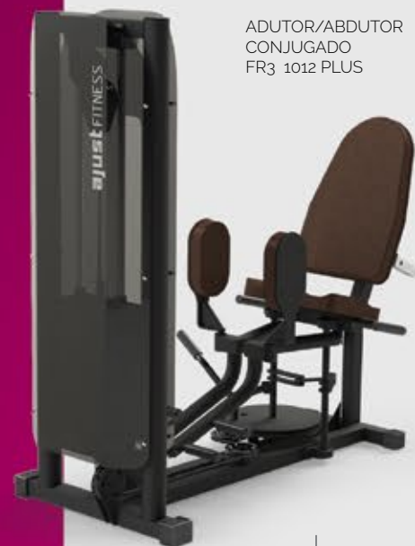
ADUTOR/ABDUTOR CONJUGADO FR3 1012 PLUS