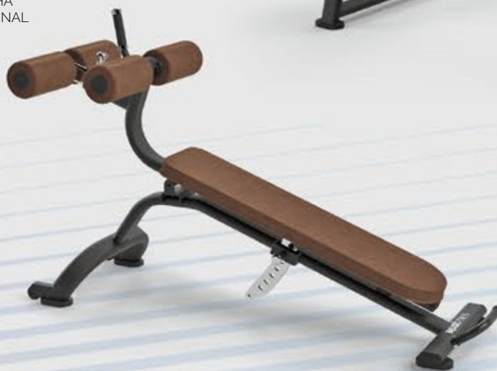
PRANCHA ABDOMINAL SL 2045

Acesse todos os produtos da Linha Soul pelo QR Code