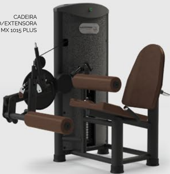
CADEIRA FLEXO/EXTENSORA MX 1015 PLUS