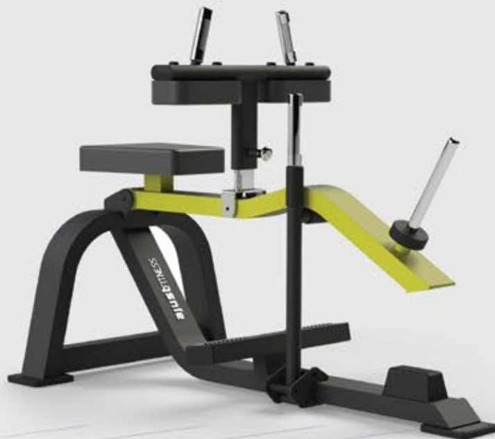
ARTICULADO PANTURRILHA SENTADA Seated Calf AT 1036

• Suportes de anilhas cromados (opcional para anilhas olímpicas)