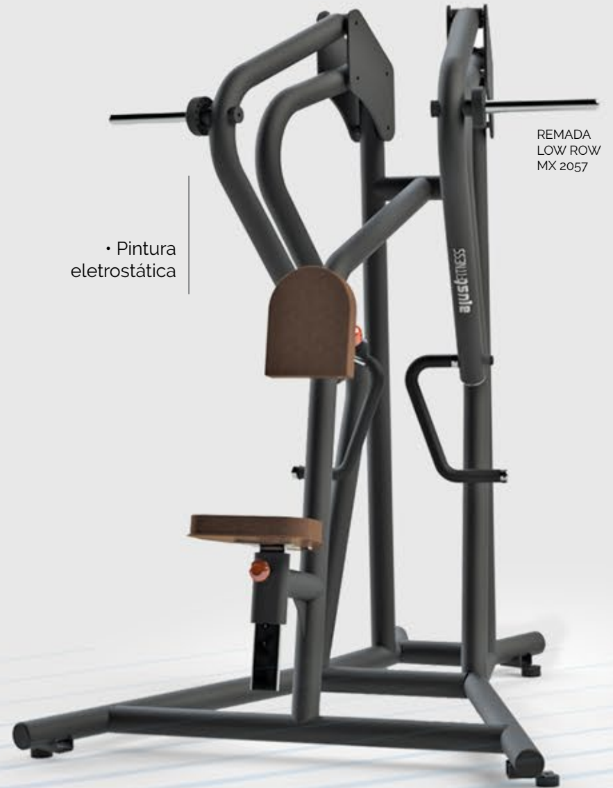
REMADA LOW ROW MX 2057