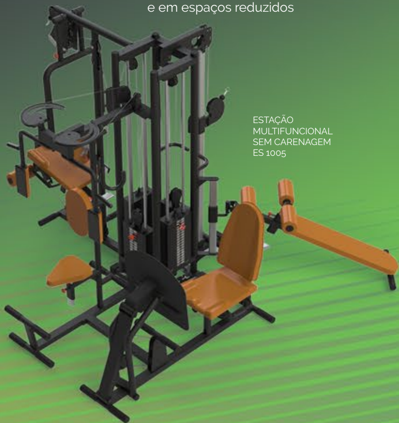
ESTAÇÃO MULTIFUNCIÓNAL SEM CARENAGEM ES 1005