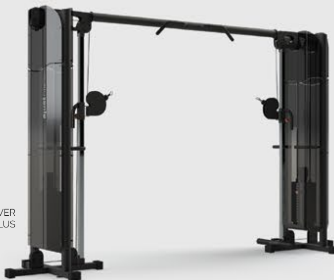
CROSS OVER FR3 3010 PLUS