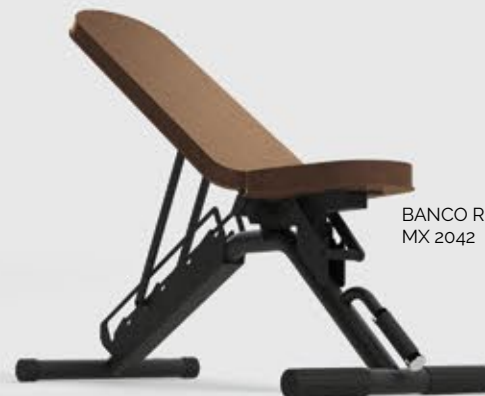
BANCO REGULÁVEL MX 2042