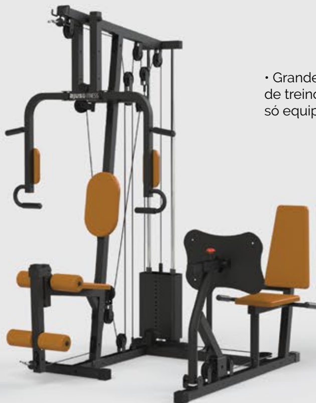
ESTAÇÃO MULTIFUNCIONAL COM LEG PRESS SEM CARENAGEM ES 1002

• Grande variedade de treinos em um só equipamento