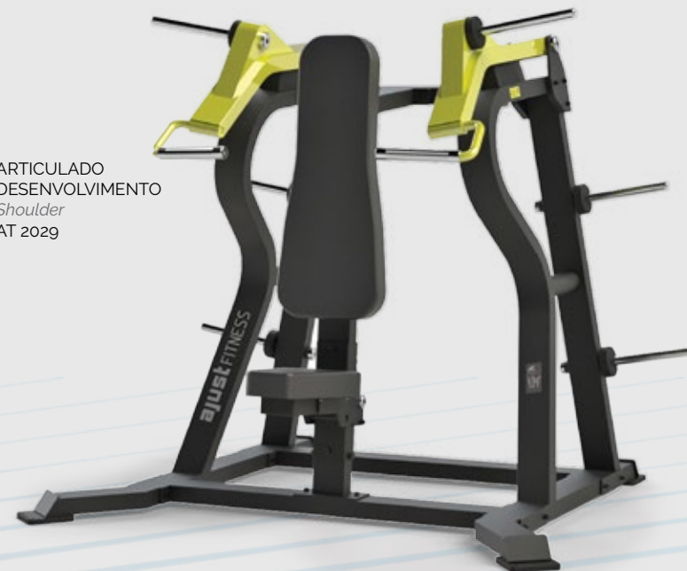
ARTICULADO DESENVOLVIMENTO Shoulder AT 2029