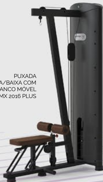
PUXADA ALTA/BAIXA COM BANCO MÓVEL MX 2016 PLUS