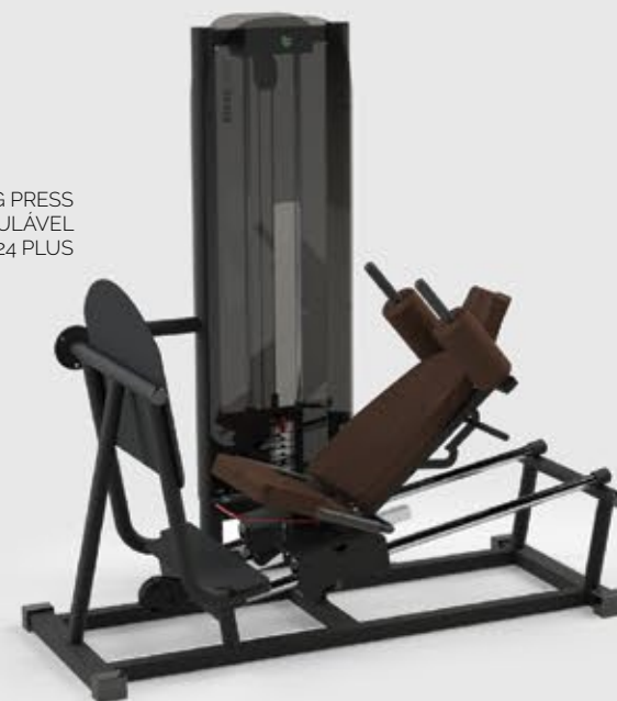
LEG PRESS BANCO REGULÁVEL FR3 1024 PLUS

Todos os equipamentos da Linha FR3 podem ser produzidos com carenagem total (Plus) ou baixa. Veja a diferença nos equipamentos acima.