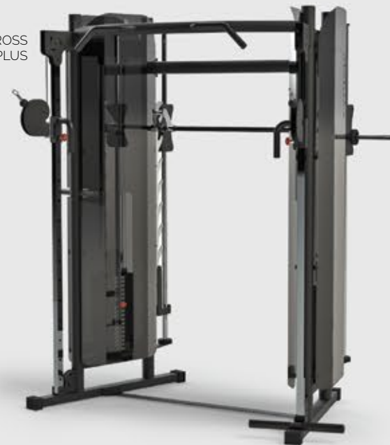
MULTI CROSS FR3 3015 PLUS