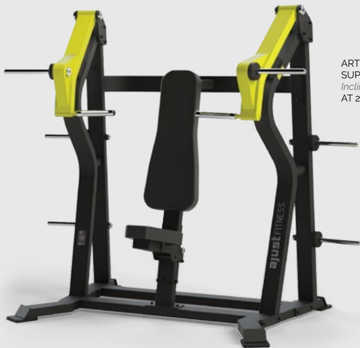
ARTICULADO SUPINO INCLINADO Incline Chest Press AT 2026