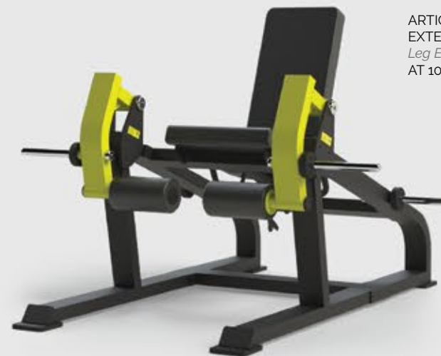
ARTICULADO EXTENSOR Leg Extension AT 1014