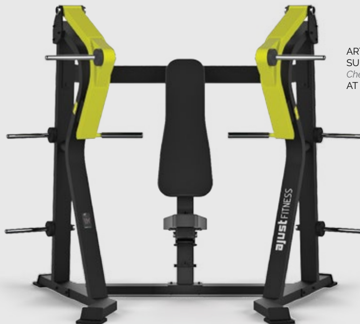
ARTICULADO SUPINO RETO Chest Press AT 2027