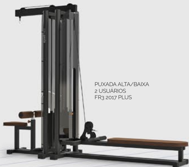
PUXADA ALTA/BAIXA 2 USUÁRIOS FR3 2017 PLUS