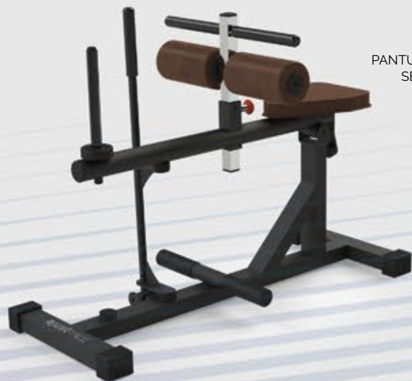
PANTURRILHA SENTADO FR 1036