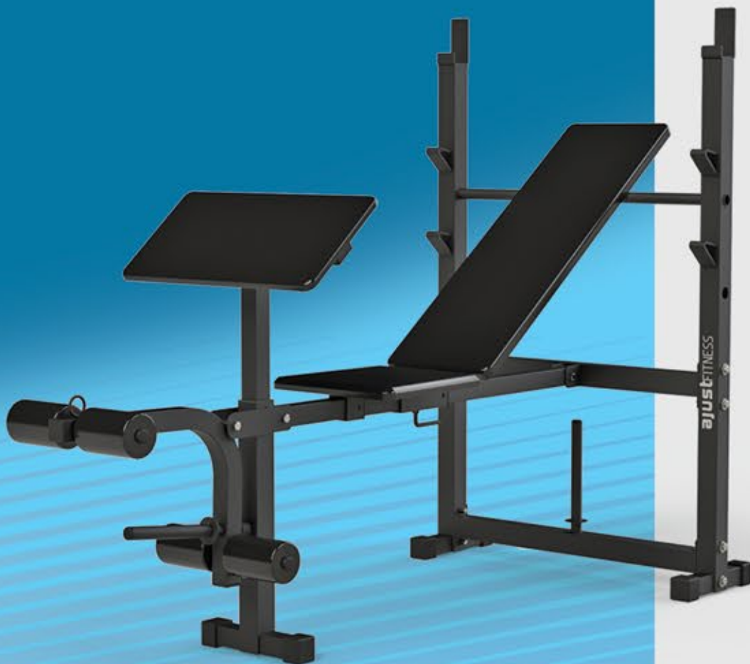
MULTIBANCO RESIDENCIAL HM 2065

QUALIDADE PROFISSIONAL EM EQUIPAMENTOS DE USO RESIDENCIAL