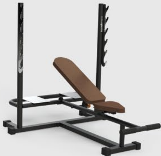
BANCO DE SUPINO REGULÁVEL RETO/INCLINADO FR 2050