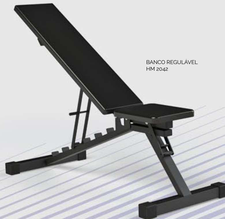
BANCO REGULÁVEL HM 2042