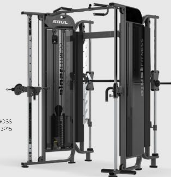
MULTI CROSS SL 3015