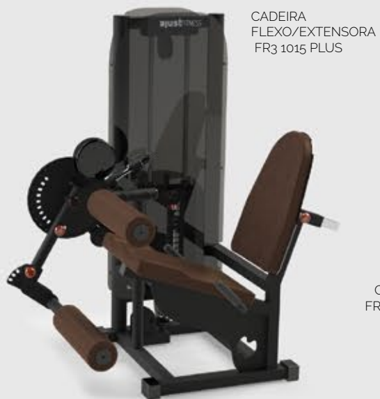
CADEIRA FLEXO/EXTENSORA FR3 1015 PLUS