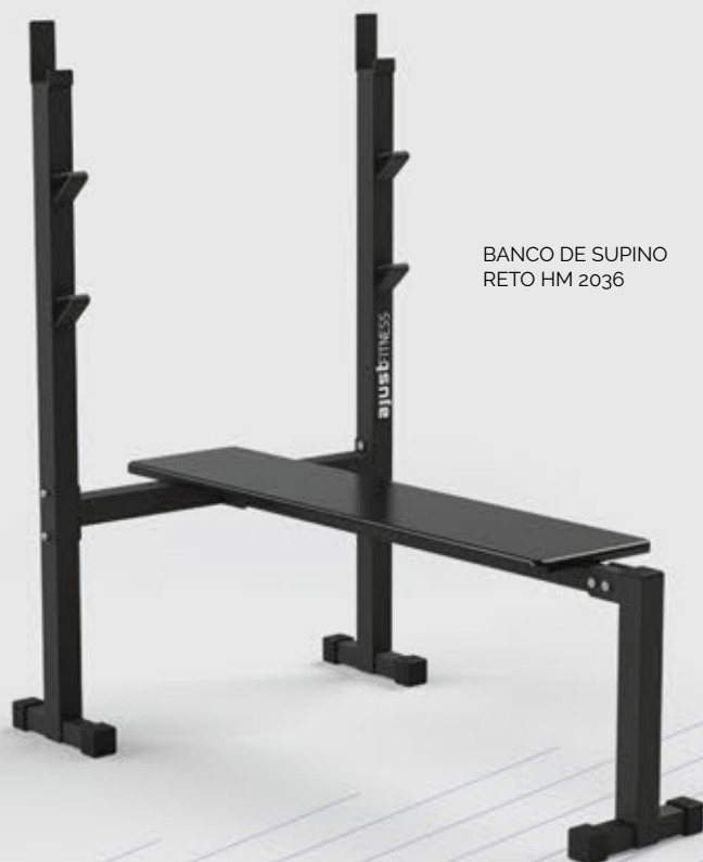
BANCO DE SUPINO RETO HM 2036