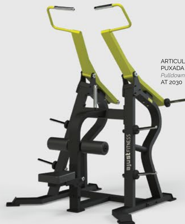
ARTICULADO PUXADA ALTA Pulldown AT 2030