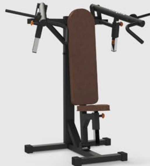
DESENVOLVIMENTO ARTICULADO FR 2029