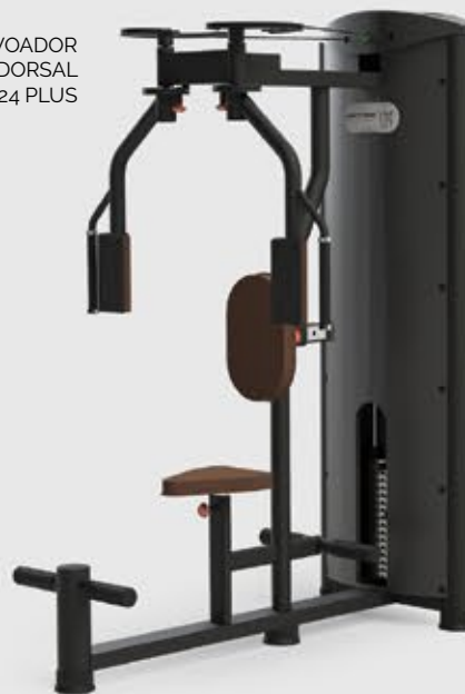
VOADOR PEITORAL/DORSAL MX 2024 PLUS